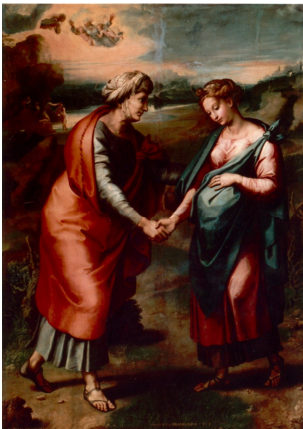
Fig.4 Madrid, Museo Del Prado: Raffaello "La Visitazione"

La solida amicizia con l'artista si protrasse per l'intera vita di Giovanni Battista che fu dal Sanzio stesso nominato suo esecutore testamentario come ancor oggi attesta l'epigrafe presente nel Pantheon a Roma.